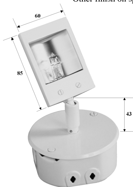
Cotes en mm