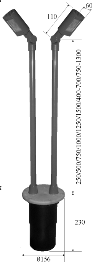
Cotes en mm